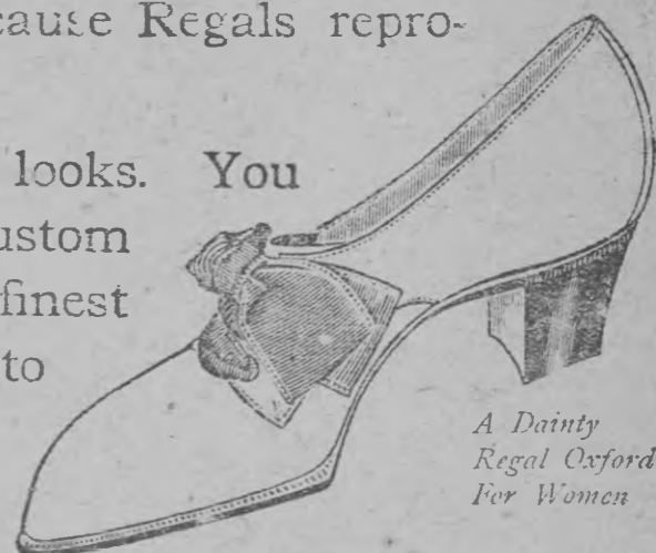
A Dainty Regal Oxford For Women